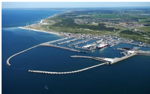
شکل ۲- نمونه موج شکن

هر شکل و نمودار باید دارای شماره و عنوان (توضیح) باشد که به صورت وسط‌چین در زیر آن با قلم ب نازنین پررنگ و اندازه ۱۰ pt. تایپ و به ترتیب از ۱ شماره‌گذاری می‌شود. نمودارها و شکل‌ها به گونه‌ای باشد که در صورت چاپ سیاه و سفید، رنگ‌ها و جزئیات آنها قابل تشخیص باشد. شکل‌ها در داخل متن و در جایی که به آنها ارجاع می‌شود، درج گردند. ذکر واحد کمیت‌ها در شکل‌ها الزامی است. هر شکل را با یک سطر خالی فاصله از متن ما قبل آن قرار دهید. یک سطر فاصله نیز بعد از عنوان شکل در نظر گرفته شود. شکل‌ها و جداول باید حتما در متن ارجاع داده شوند. نمونه شکل مورد قبول در شکل ۲ آمده است. (توجه شود که خود شکل‌ها و نمودارها نیز، همانند جدول‌ها باید در موقعیت وسط‌چین نسبت به طرفین کاغذ قرار گیرند.)